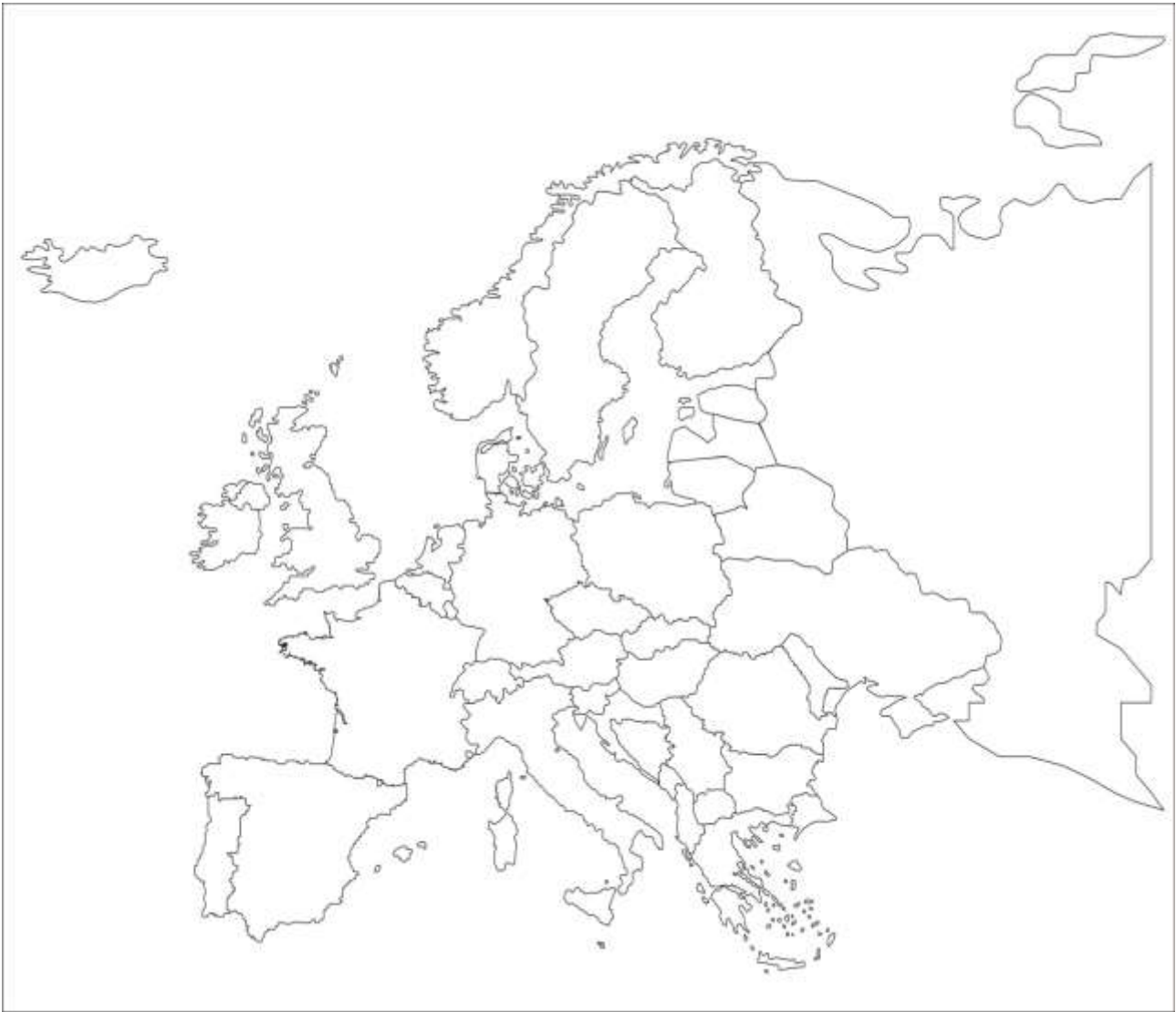
Рис. 1. Контурна карта Європи